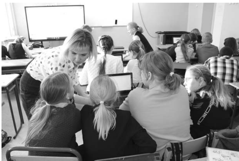
Сообща любые задачи решать легче

"Платформа никогда не заменяет учителя на уроке. Она является дополнением и помощью к освоению образовательной программы по указанным предметам. Сама программа не отличается от тех, по которым идут другие классы. Отличается способ подачи материала. Но даже в указанных предметах, не все темы изучаются с помощью "Школьной Цифровой Платформы". Она предполагает частичное изучение материала, а