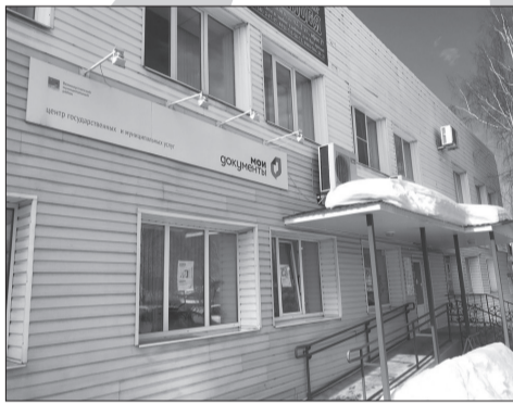
Центр «Мои документы»