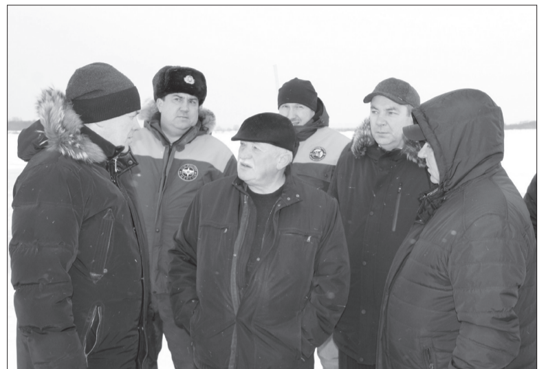
Мониторинг ледовой обстановки ведется ежедневно

Союз русских Ганзейских городов был создан в 2010 году, он объединяет 187 городов из 16 стран Европы. Сегодня к городам «русской Ганзы» относятся Белозерск, Великий Новгород, Вологда, Ивангород, Калининград, Кингисепп, Порхов, Псков, Смоленск, Тверь, Тихвин, Торжок, Тотьма, Вышний Волочек и, конечно, Великий Устюг, который будет встречать гостей уже в следующем году. Подготовка к проведению масштабного фестиваля в нашем городе продолжается не первый год, работы предстоит сделать много. Сам праздник состоится в Ве-