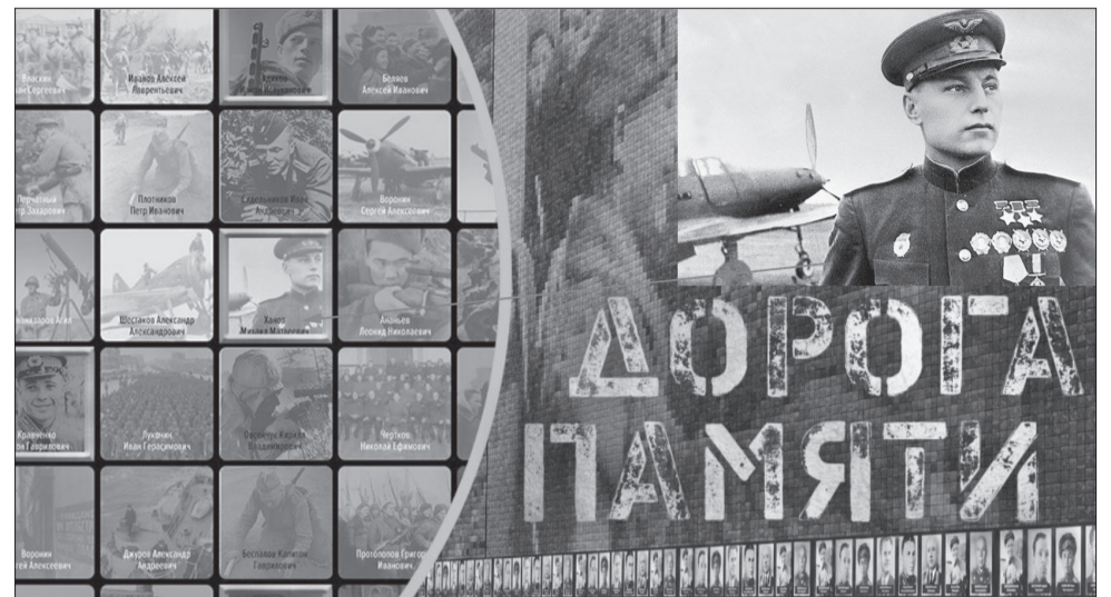
Нажав на фото, можно узнать о судьбе фронтовика

Результатом соотнесения архивных документов и создания перечня участников войны станет единая база данных, насчитывающая почти 30 млн. записей обо всех солдатах и офицерах, воевавших на стороне Красной армии. После формирования именных списков защитников Отечества предстоит огромная работа по поиску и наполнению информационного ресурса