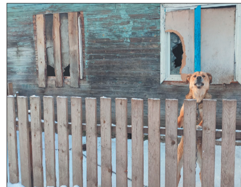
Без удобств, но с надеждой на лучшее СТР. 9

21 февраля № 7 ВЫХОДИТ 2020 года (19894) ЕЖЕНЕДЕЛЬНО