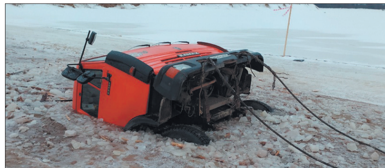
КАМАЗ с песком провалился 14 февраля. Водитель не пострадал