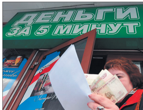
Не все микрозаймы одинаково полезны СТР. 4