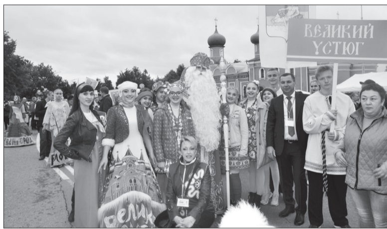
Великий Устюг встретит международный фестиваль в 2021 году

Виктория Врабие