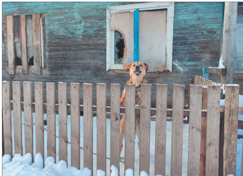
Незваных гостей встречает собака