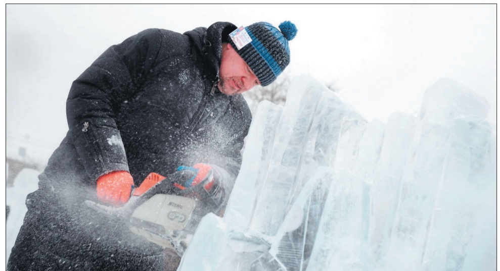
«Работать со льдом намного сложнее, чем с деревом»

– Работать со льдом намного сложнее, чем с деревом. Лед – тяжелый и хрупкий материал, да и с погодой приходится считаться. Особенно ветер может преподнести «сюрпризы». Но мы трудностей