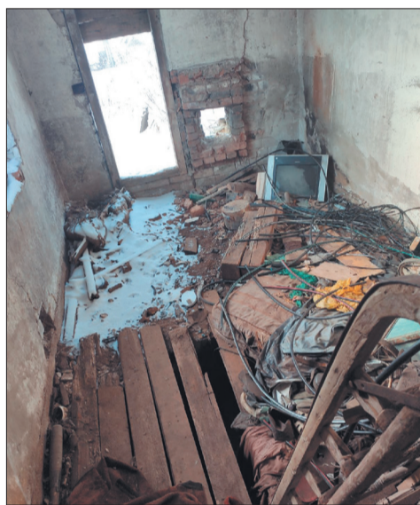
Большинство квартир пустуют