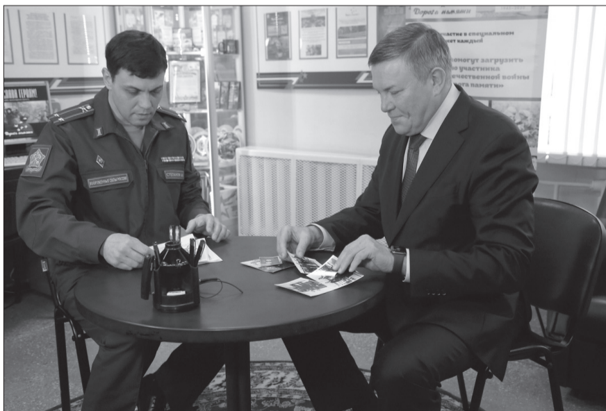
Давайте вместе сохраним историю!

Губернатор Вологодской области Олег Кувшинников вписал в историю имена своих героических дедов. Проект «Дорога Памяти» объединяет людей. Вологодчина вместе со всей страной создает огромную базу данных, в которой будет информация об участниках Великой Отечественной войны.