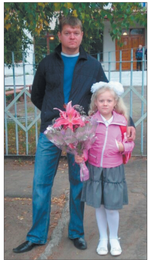
В первый раз в первый класс