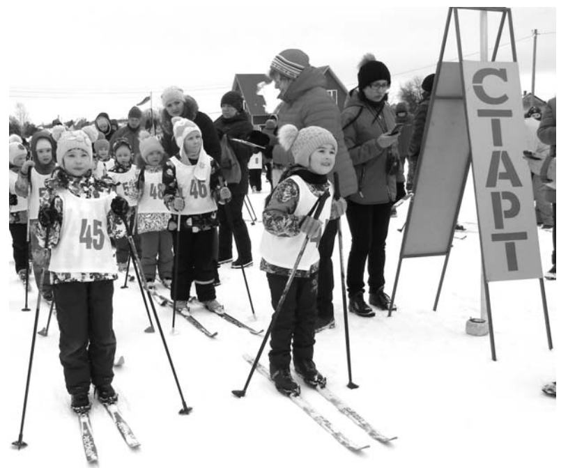
Волнительный момент перед стартом

«Я веду активный образ жизни, люблю прогулки на лыжах, поэтому решила поучаствовать в соревнованиях, узнать свои возможности и испытать себя. В этом