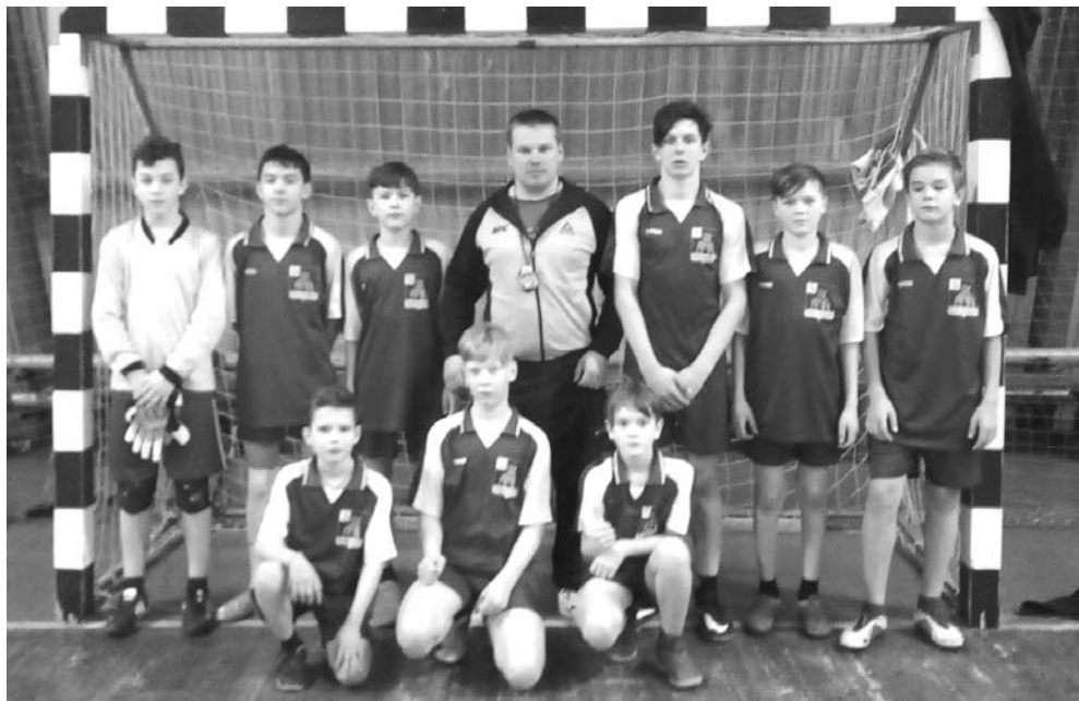
Команда юных футболистов Никольской ДЮСШ

Гордимся, поздравляем! Впереди – финальные игры. Надеемся, что и они станут для наших футболистов удачными.