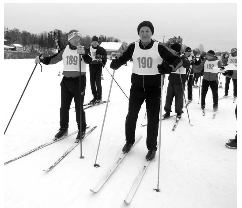
Ветераны – пример для молодёжи

году я не сдавала нормы ГТО, но в следующем – обязательно сдам, потому что быть обладателем знака отличия комплекса «Готов к труду и обороне» – почетно», – говорит одна из лыжниц.