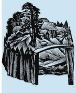
Тарногский Городок основан в 1453 году

Новости дня * официальные документы * культура * спорт * областные новости * программа ТВ * реклама