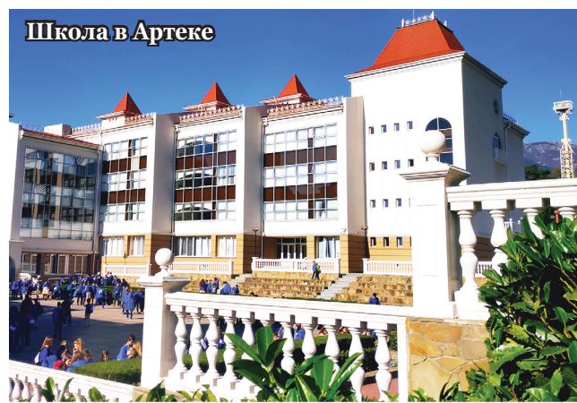
Школа в Артеке