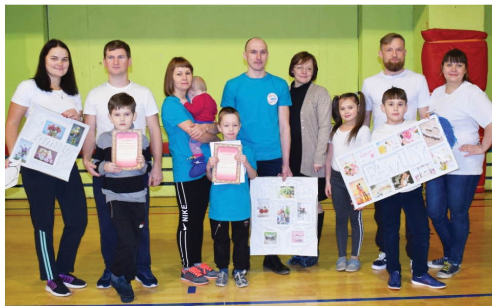
Участники конкурса Богатырские забавы

Материал подготовлен при поддержке Управления информационной политики в рамках проекта «Дом, семья и дети»