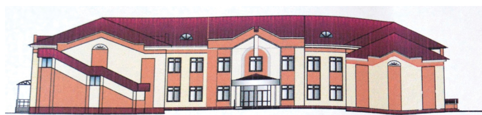
Проект нового дополнительного здания для школы № 65

Юрий Парфенов рассказал, что выбрана экономически эффективная проектная документация повторного использования из соответствующих реестров Министерства строительства и ЖКХ РФ на строительство здания начальных классов со спортивным залом. Именно с этим проектом ознакомились учителя и родители образовательного учреждения. В здании по этому проекту предусмотрены 8 учебных кабинетов, спортивный и актовый залы, комната для группы продлённого дня. В ближайшее время администрация района намерена заниматься подготовкой документации для вступления в федеральную программу. Борисовская средняя школа также требует ремонта. Глава района предложил коллективу учреждения определиться с первоочередными работами, которые будут выполняться летом текущего года. Понимая остроту вопроса ремон-