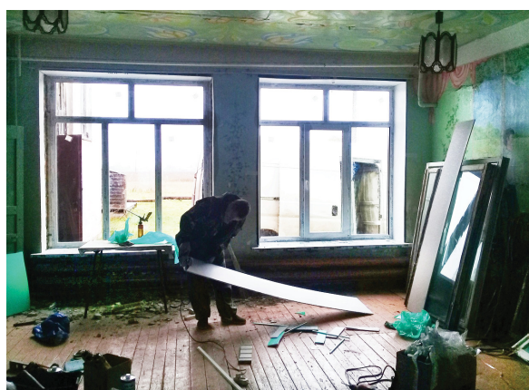
В минувшем году в рамках «Народного бюджета» в Пожарском ДК были установлены 5 стеклопакетов в фойе и служебных помещениях, а также две железные двери

Для занятий спортом проектом предусмотрены установка уличных тренажеров на улице Мира, спортивной площадки на Набережной, площадки для воркаута для подростков в