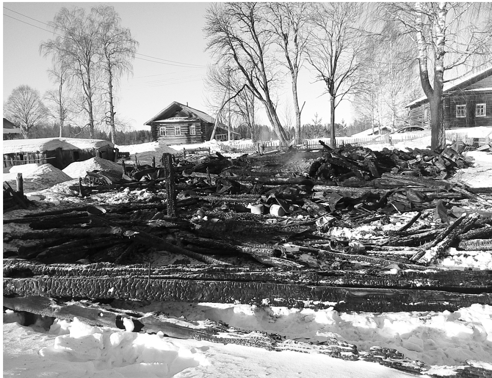
На месте пожара.