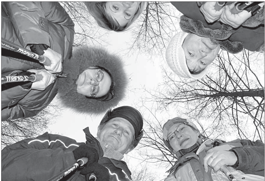
Спорт, здоровое питание и отказ от вредных привычек становятся важными правилами жизни для жителей деревни Климовское.