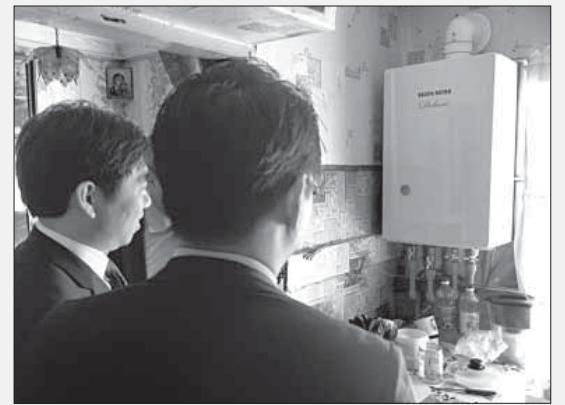
Публикуется на правах рекламы

Такие дела естественны для клиентоориентированной фирмы, - рассказывает предприниматель. - Большое значение имеют индивидуальный подход к покупателю и сервис, позволяющий быстро и эффективно решать все вопросы. Мы много внимания уделяем консультированию покупателей, обучаем газовиков, обеспечиваем запчастями, чтобы у них не было проблем с обслуживанием нашего оборудования. Клиент уверен,