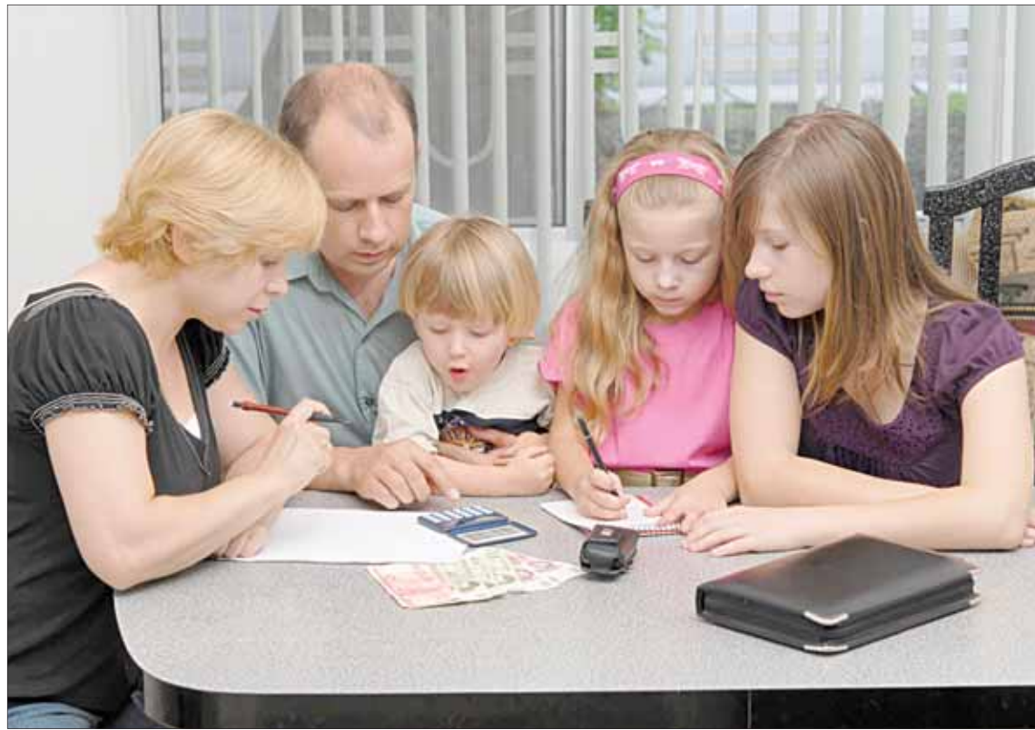
Если семья оказалась в сложном финансовом положении, это вовсе не повод для отказа в развлечениях и приятных мелочах. А вот пережить трудные времена всегда легче вместе.

1) Для многих домашняя бухгалтерия становится опытом осознанности и дисциплины. Владение ситуацией в одном из направлений деятельности при-