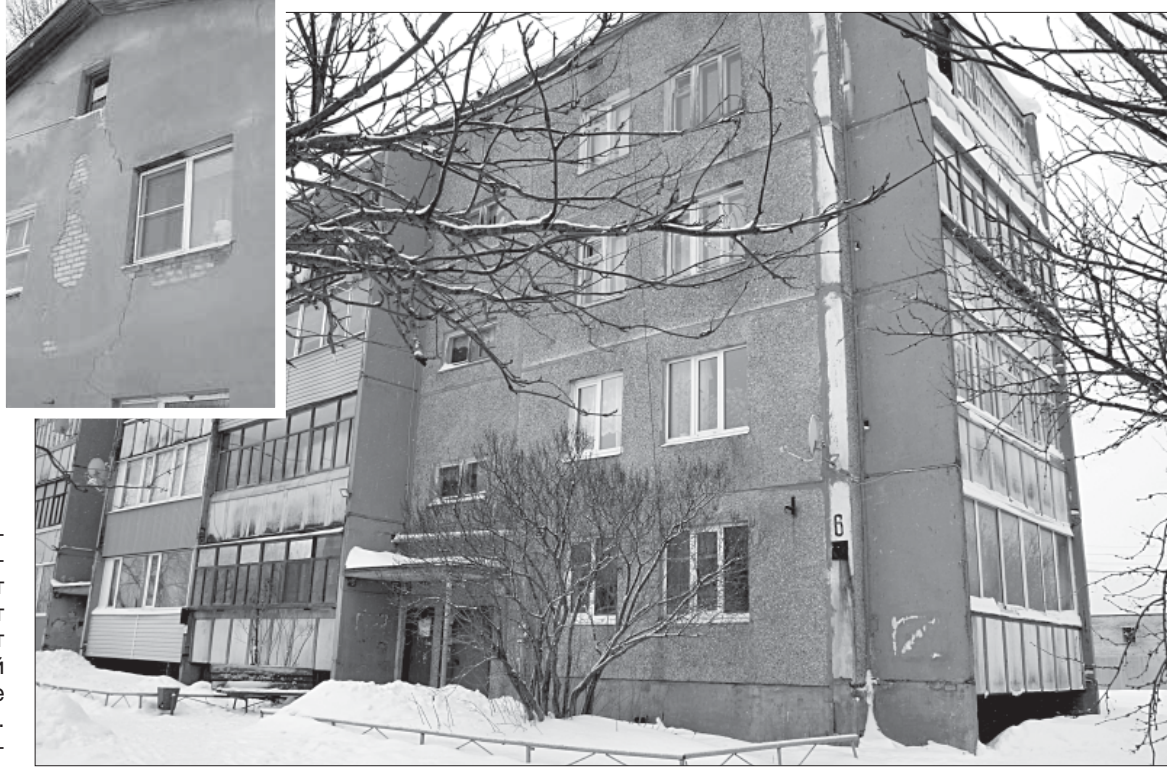
Один из минусов накопления взносов в «общем котле» - возможность перераспределения средств одного дома на другой. Так произошло и в Ирдоматке с домами №11 и 6 по улице Новой.