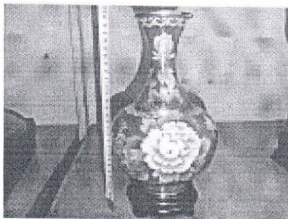
Предмет продажи – заявленная ваза как китайская фарфоровая